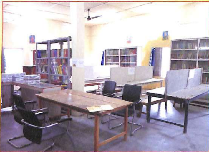
গ্ৰন্থাগৰৰ ভিতৰ চ'ৰা