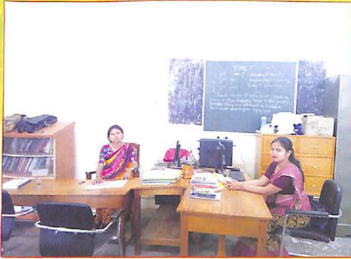
গ্ৰন্থাগাৰত কৰ্মৰত বিষয়াবৰ্গ