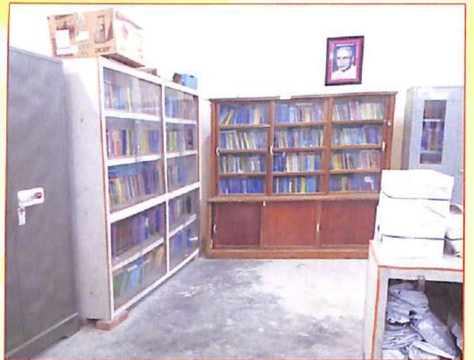
গ্ৰন্থাগৰৰ ভিতৰ চ'ৰা