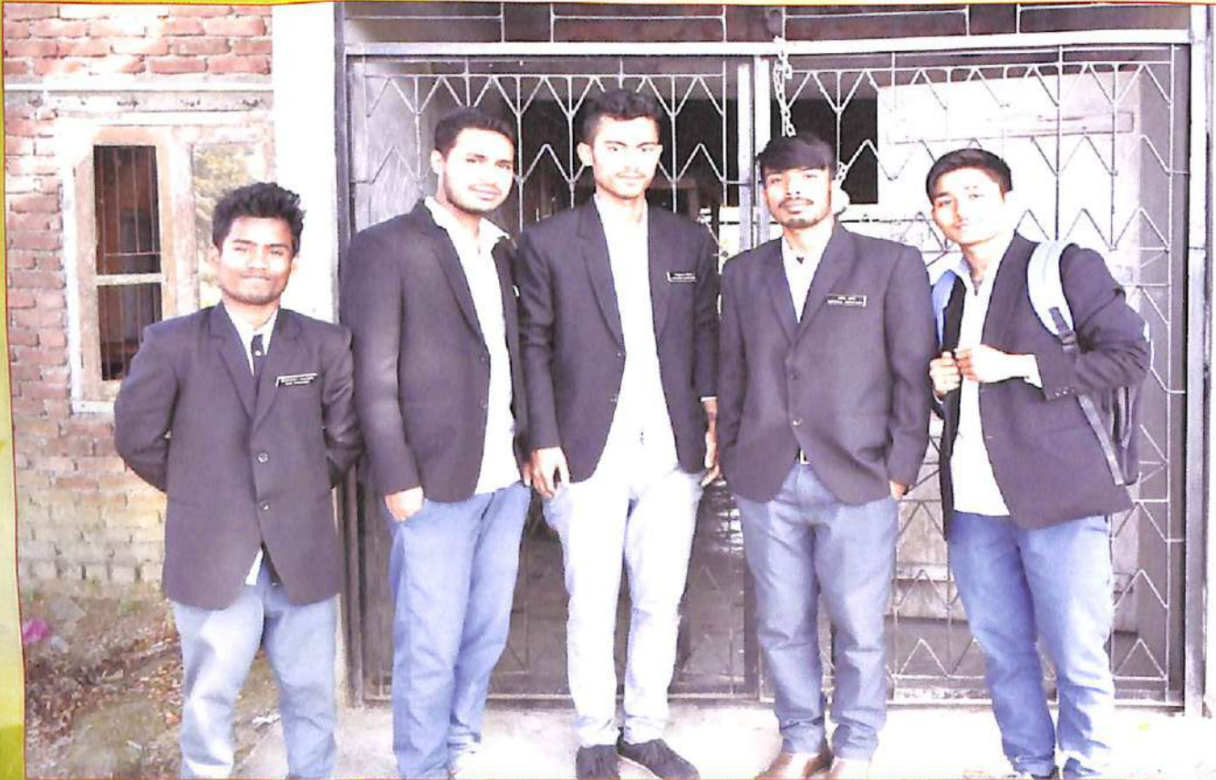
ছাত্র একতা সভার ২০১৭-২০১৮ বর্ষের একাংশ