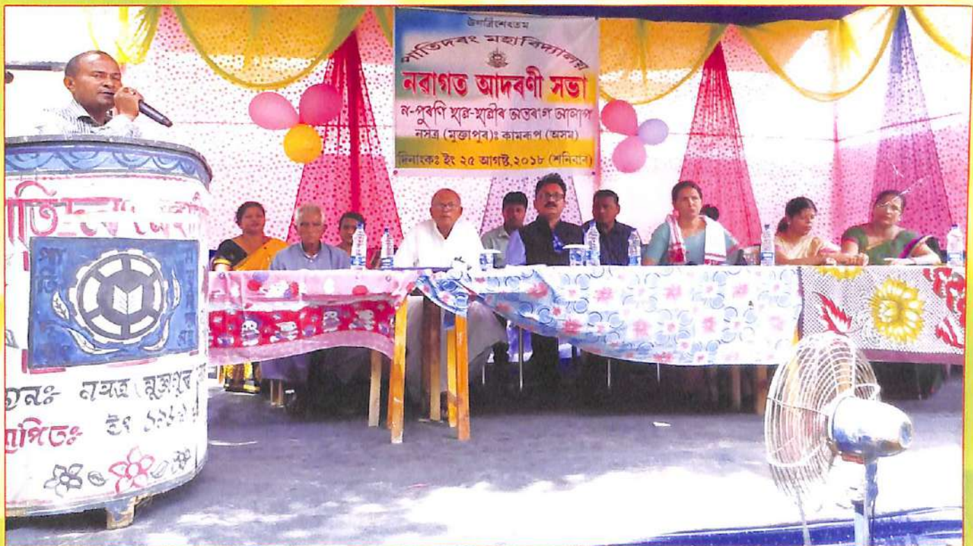
নৱাগত আদৰণীসভাৰ মুকলি সভাৰ এটি মুহূৰ্ত