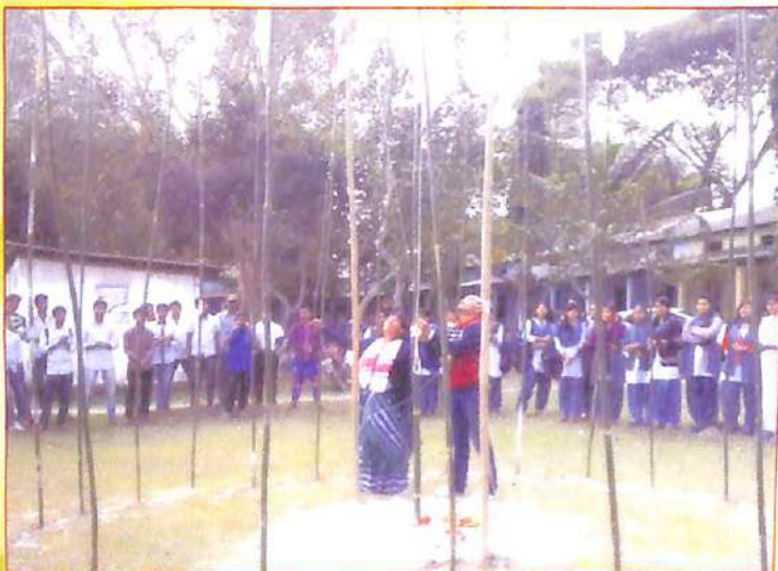
খেলাসপ্তাহৰ এটি মুহূৰ্ত