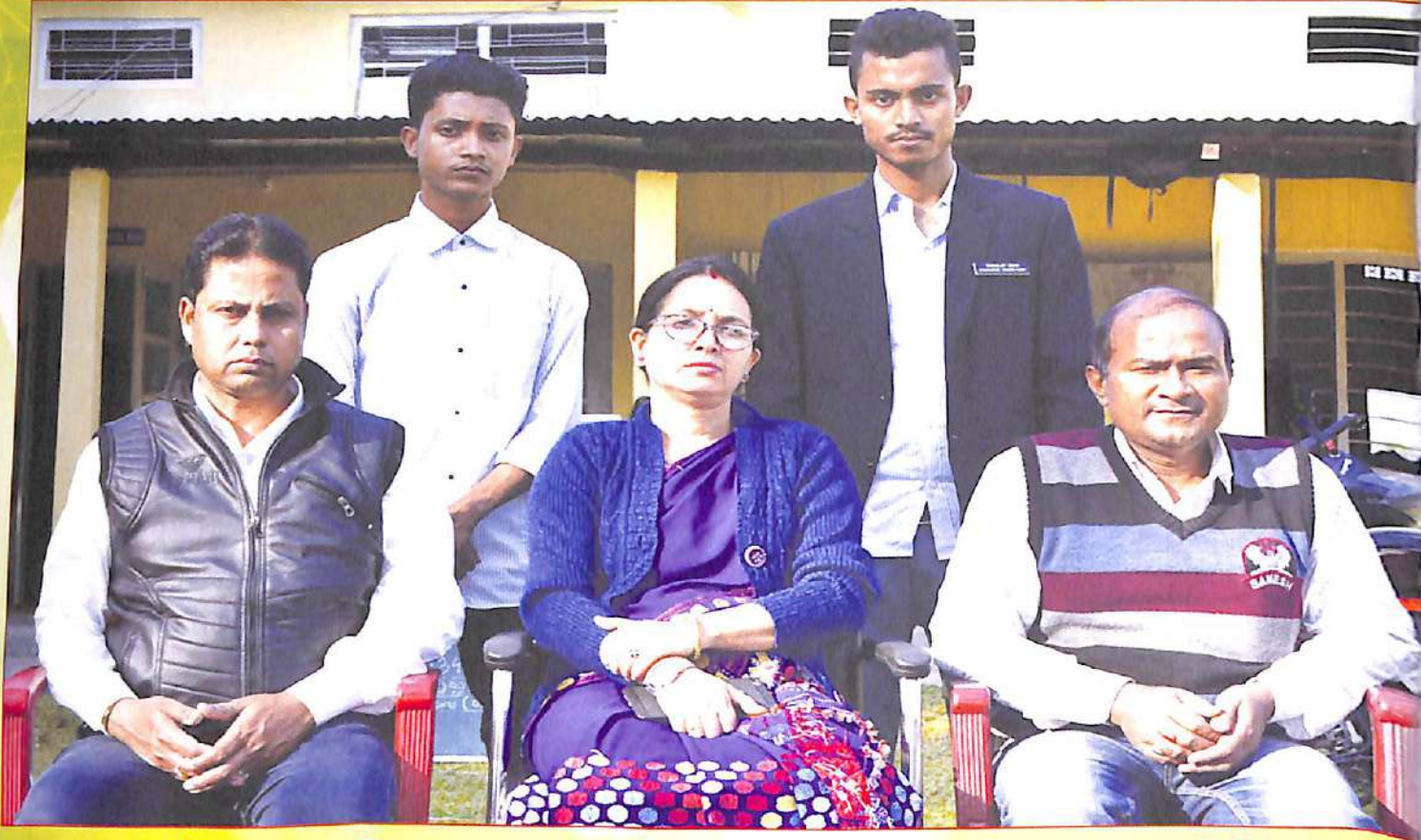
পাতিদ্রবং মহাবিদ্যালয় আলোচনী ২০১৭-২০১৮ বর্ষ সম্পাদনা সমিতি