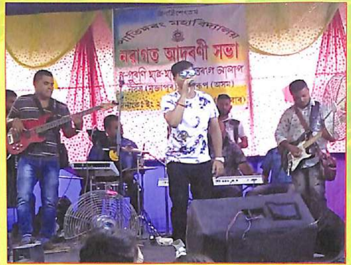
নৱাগত আদৰণী সভাত শিল্পীৰ গীত পৰিবেশন