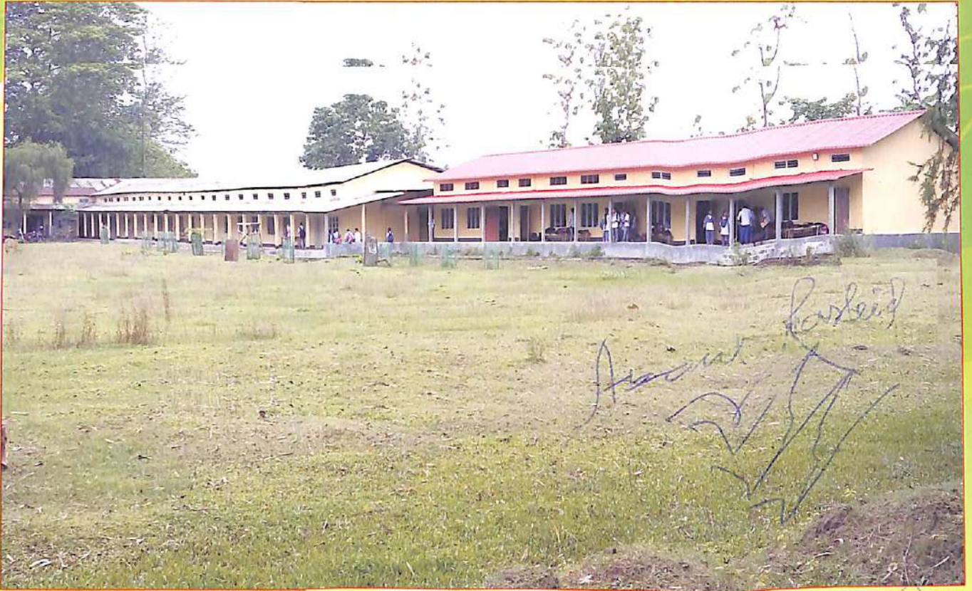
মহাবিদ্যালয়ৰ পুৰনি আৰু নৱনিৰ্মিত ভৱনৰ একাংশ