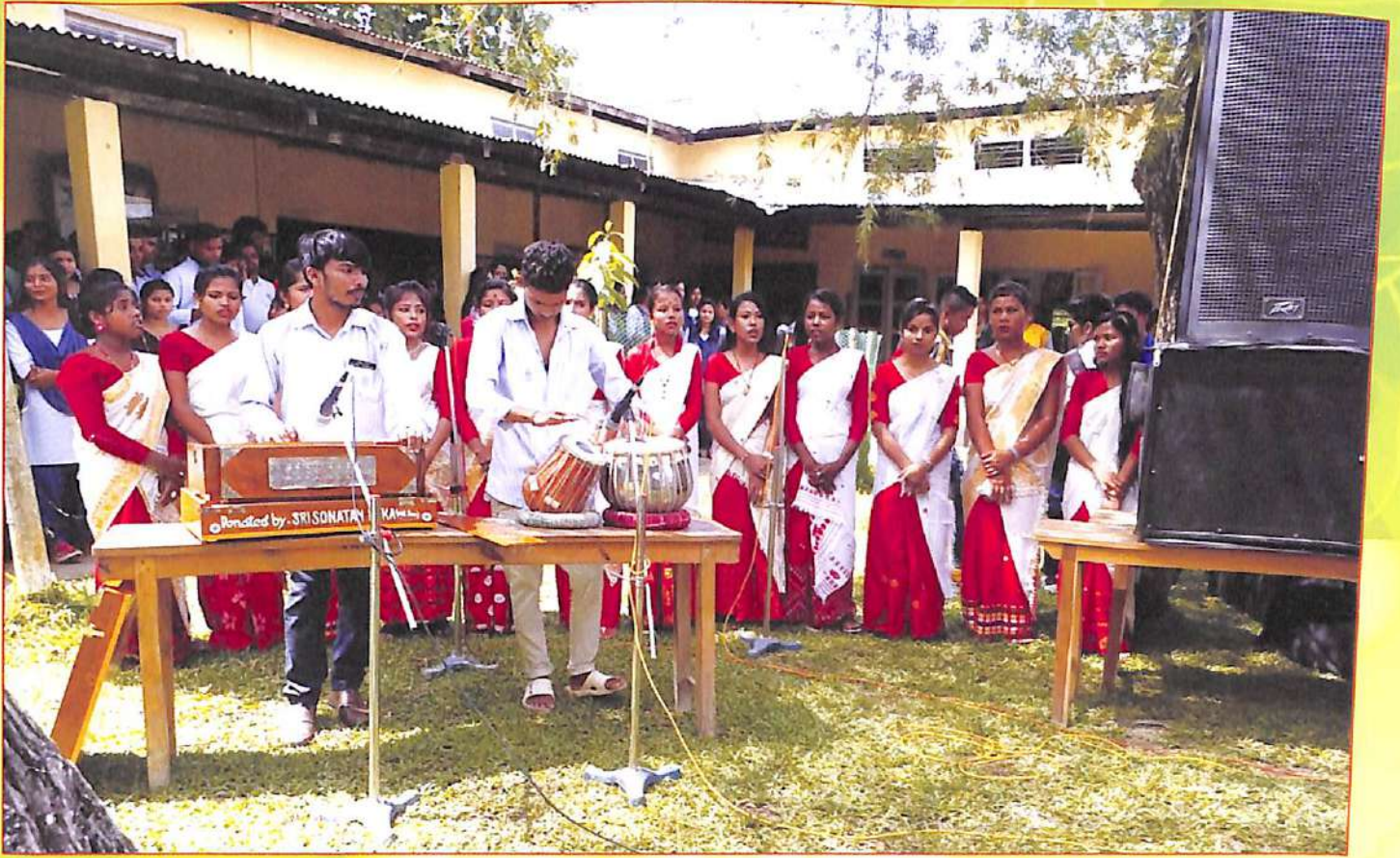
নৱাগত আদৰণীসভাৰ আৰম্ভণী গীত পৰিবেশনৰ মুহূৰ্ত