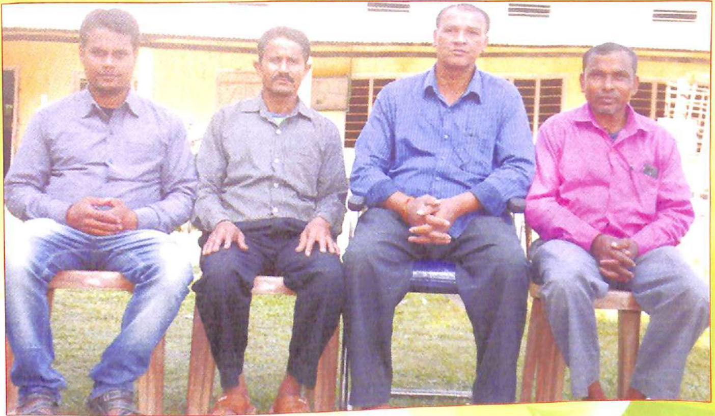
মহাবিদ্যালয়ৰ কৰ্মচাৰীৰ একাংশ