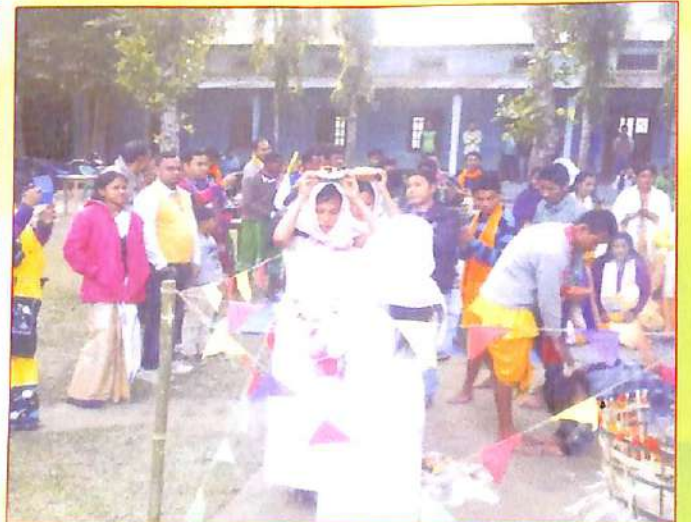
বাৰ্থৌ পূজাৰ এটি মুহূৰ্ত