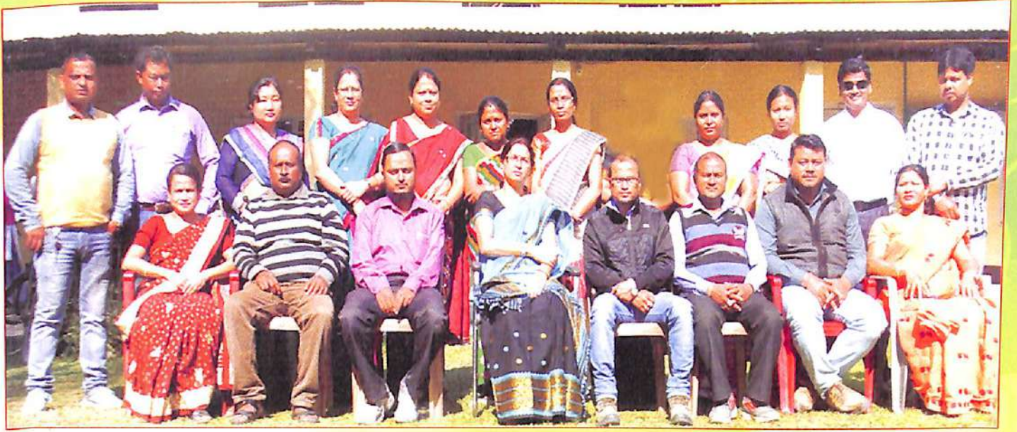
মহাবিদ্যালয়ৰ শিক্ষক শিক্ষয়িত্ৰীৰ একাংশ