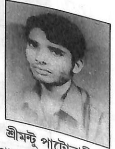
শ্ৰীমক্টু পাটোৱাৰী সম্পাদক লঘু খেল বিভাগ