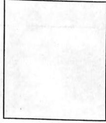
শ্ৰীগিৰীশ বৰ্মণ উপ-সভাপতি